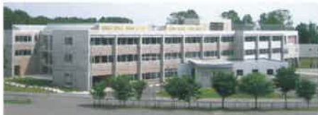
特別養護老人ホーム 敬生園