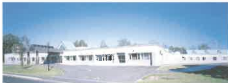
障害者支援施設 敬愛園