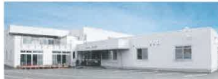
養護老人ホーム 敬心園