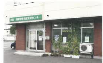
北星・旭星地域包括支援センター

令和2年11月北彩都地区に予防医学を含めた総合病院として地域医療に貢献するため新築移転