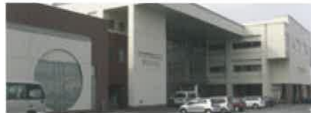
旭川障害者総合相談支援センター あそーと