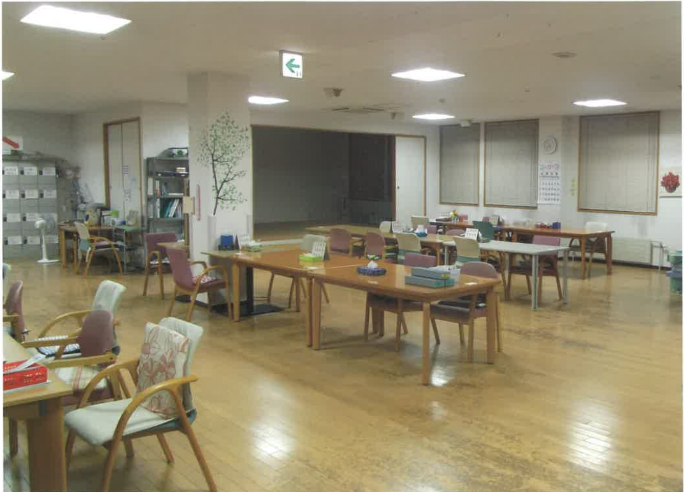
通所リハビリテーション事業所内